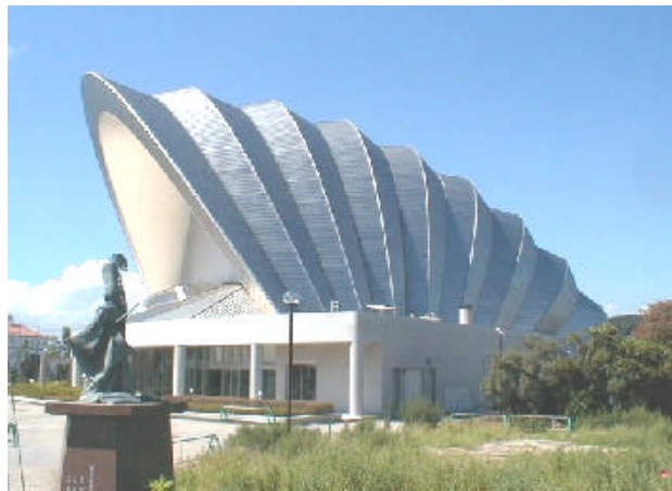
しずかホール（淡路）