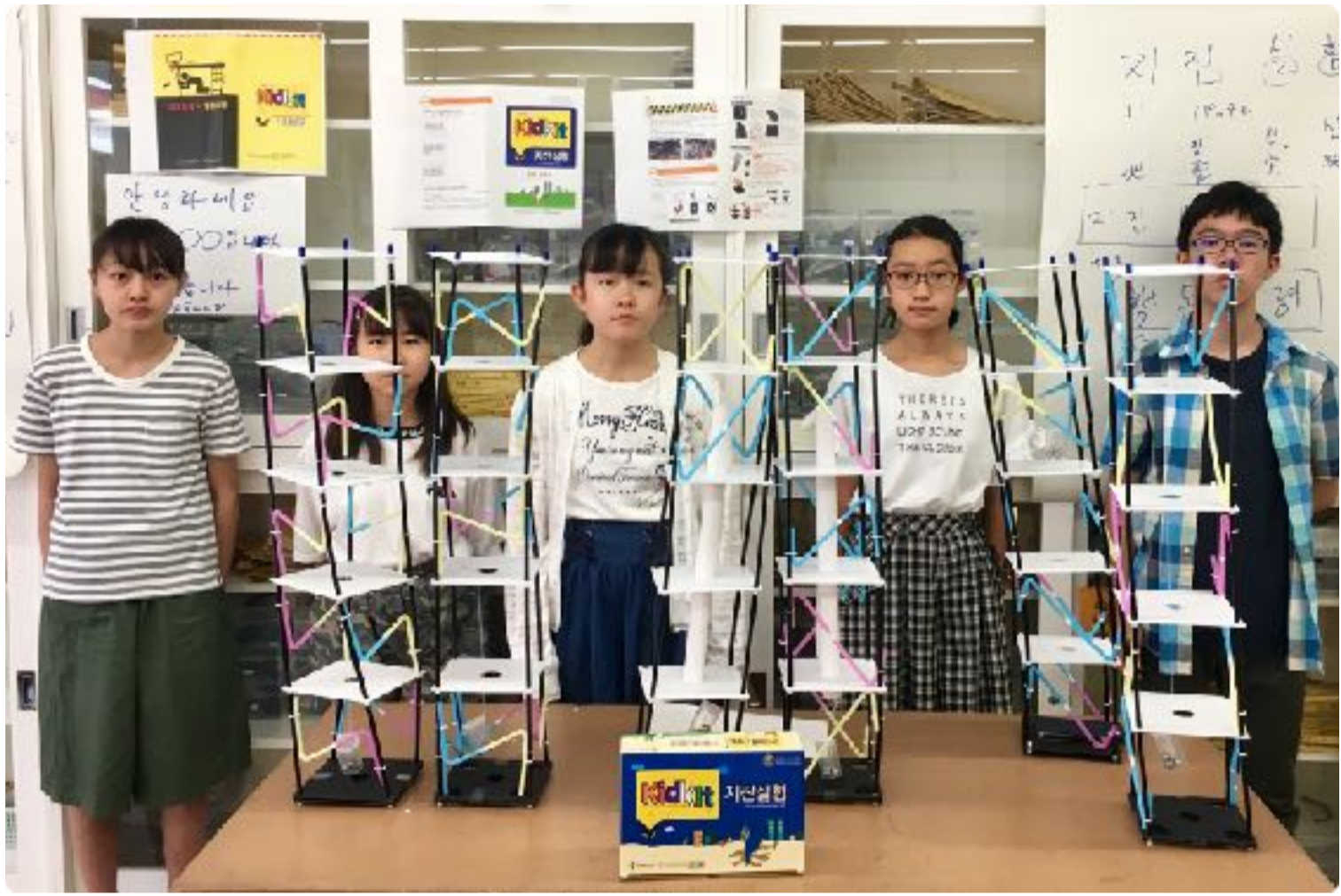
高層ビルの揺れをいかに抑えるかという工夫がわかります。